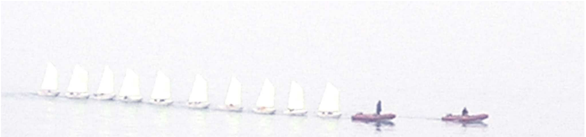
Tableau 1 : Les différents plans du paradigme positif